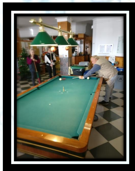
Finn indvier en af de nye køer.