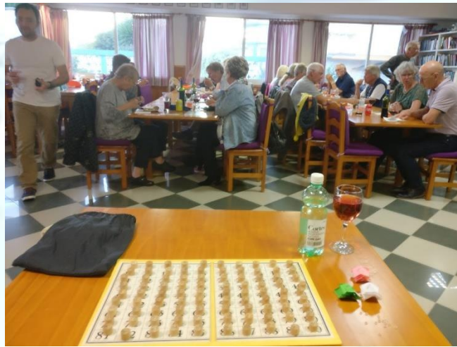
38 glade medlemmer er klar til Banko.