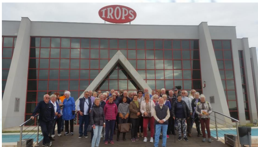
Hele flokken foran TROPS.